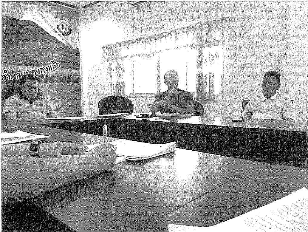
ภาพประชุมแจ้งนโยบายการรับร้องเรียน วันที่ 9 สิงหาคม 2566